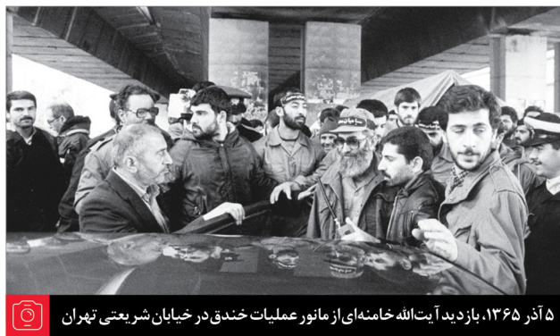
۱۳۶۵، آذر ۱۳، بازدید آیت‌الله خامنه‌ای از مانور عملیات خندق در خیابان شریعتی تهران

بصیرت لازم است - جزو شرطهای لازم است - مجاهدت لازم است، ثبات لازم است. عزیزان من! ثبات در این راه، استقامت در این راه، یکی از واجب‌ترین و مهم‌ترین عوامل پیشرفت است. سعی کنید محیط خودتان را، پیرامون خودتان را، عناصر مرتبط با خودتان را، و پیش از همه، درون و دل خودتان را وفادار و باثبات نگه دارید نسبت به این آرمانها و نسبت به این راه و نسبت به این اهداف والا؛ قطعاً پیروز خواهید شد، قطعاً پیروزی با شما خواهد بود... امروز در زمینه‌ی اقتصادی کارهای زیادی لازم است که ما انجام بدهیم؛ در زمینه‌ی تولید و اشتغال و این چیزها - که ضعفهای ما است - کارهای فراوانی است که باید انجام بدهیم؛ در زمینه‌ی فرهنگی کارهای زیادی است که باید انجام بدهیم؛ این کارها امروز در حد برنامه‌ریزی و اقدام و شروع و پیشرفت و گذراندن مراحل از این کارها است، اما یک روزی هم همه‌ی این کارها ان شاء الله به بهترین و جهتی انجام خواهد گرفت. ● ۱۴/۱۰/۹۶